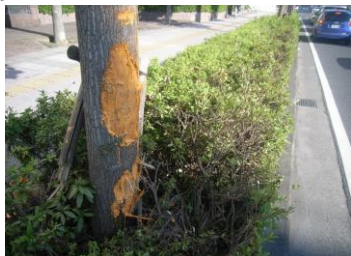
樹皮剥離を薬剤にて保護