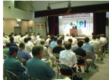
エコアクション21の紹介